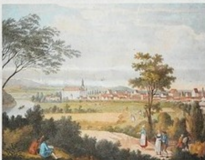
Moderne trifft auf Romantik: So sahen Künstler des 19. Jahrhunderts die Donau. Die kolorierte Lithographie von Jakob Alt zeigt eine Stadtsicht von Höchstädt.