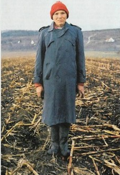
„Warten auf Europa“: Der Fotograf Frank Gaudlitz porträtierte Menschen, die an der Donau leben – ein Wegverlauf, der die Sehnsüchte widerspiegelt.