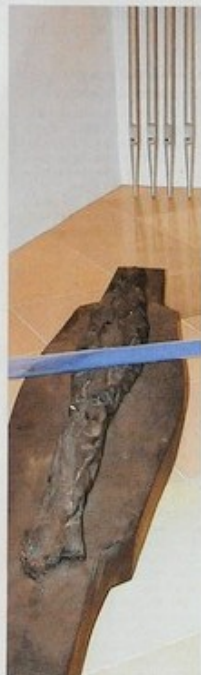
Jürgen Brodwolf's Installation stellt den Übergang vom Leben in das Reich der Toten dar.