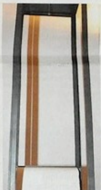
Tropfschalen von Donauwasser symbolisieren Leben, Werden und Sterben.